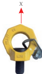
垂直方向起吊 最佳工作载荷 0内为有些WLL值